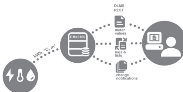
Fig. 2: Intégration Gateway à l'aide de DLMS / serveur REST