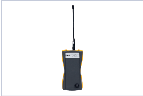
Funkempfänger MBW BLUE

Zähler mit Funk können «Drive-by» im Vorbeifahren effizient ausgelesen werden. Das mobile Gerät wird mit dem Funkempfänger per Bluetooth verbunden. Zählerstände werden bei Empfang dem Zähler zugewiesen. Die ausgelesenen Zähler werden auf der GIS-Karte automatisch ausgeblendet. Damit hat der Ausleser auf der Karte jederzeit den Überblick, an welchen Adressen noch Zähler auszulesen sind.